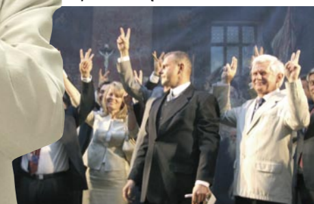
Finał przedstawienia „Od Unii Lubelskiej do Unii Europejskiej”