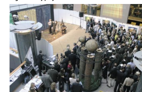
Przedstawienie artystyczne „Od Unii Lubelskiej do Unii Europejskiej”