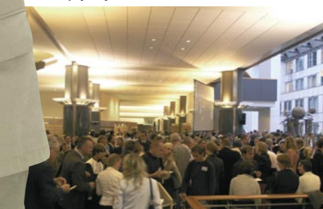
Gala finałowa i degustacja tradycyjnych potraw Lubelszczyzny