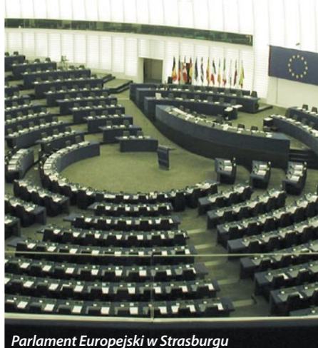
Parlament Europejski w Strasburgu

Każda z 24 komisji składa się z 25-78 posłów i każda posiada przewodniczącego, prezydium i sekretariat.