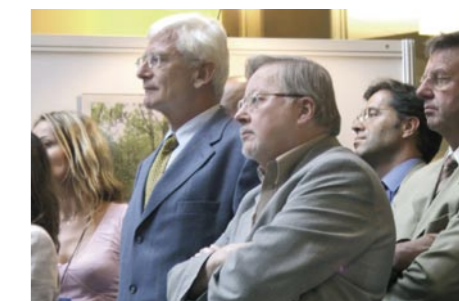
V. Landsbergis – pierwszy prezydent niepodległej Litwy

Spektakl teatralny przygotowany przez lubelskie grupy: Teatr Provisorium/Kompania Teatr był najważniejszym punktem programu. Przedstawienie zostało przygotowane w oparciu o obraz Jana Matejki „Unia Lubelska”. Jego hasłem przewodnim były słowa papieża Jana Pawła II „Od Unii Lubelskiej do Unii Europejskiej”, a swoją treścią nawiązywał do tradycji Unii Lubelskiej. Jej odtworzenie we współczesnych warunkach miało uświadomić przybyłym, że alians Polski ze Wspólnotą Europejską nie jest niczym nowym. Nie zabrakło rekwizytów z epoki ani reprodukcji obrazu Matejki. W kulminacyjnym momencie przedstawienia przybyli oficjele (wśród nich Vytatutas Landsbergis, Janusz Onyszkiewicz, Jerzy Buzek) złożyli swe podpisy na kopii obrazu. Symbolika tego gestu była bardzo wymowna zarówno w kontekście przesłania zaprezentowanego przedstawienia jak też naszego członkostwa w Unii Europejskiej. Po części oficjalnej odbył się uroczysty bankiet. Tradycyjne polskie potrawy i trunki podbiły serca gości. O sukcesie przedsięwzięcia mogły świadczyć dające się słyszeć na korytarzach Euro-Parlamentu głosy, według których promocji na tak dużą skalę jak do tej pory nie było. ■