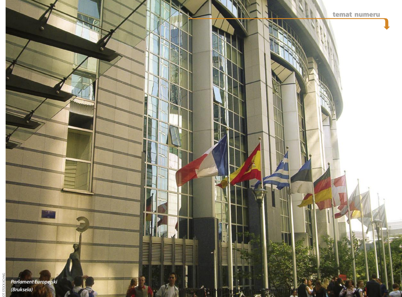
Parlament Europejski (Bruksela)