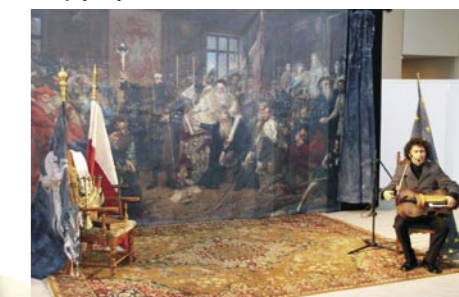
Aktor teatru Provisorium wykonuje historyczną pieśń litewską